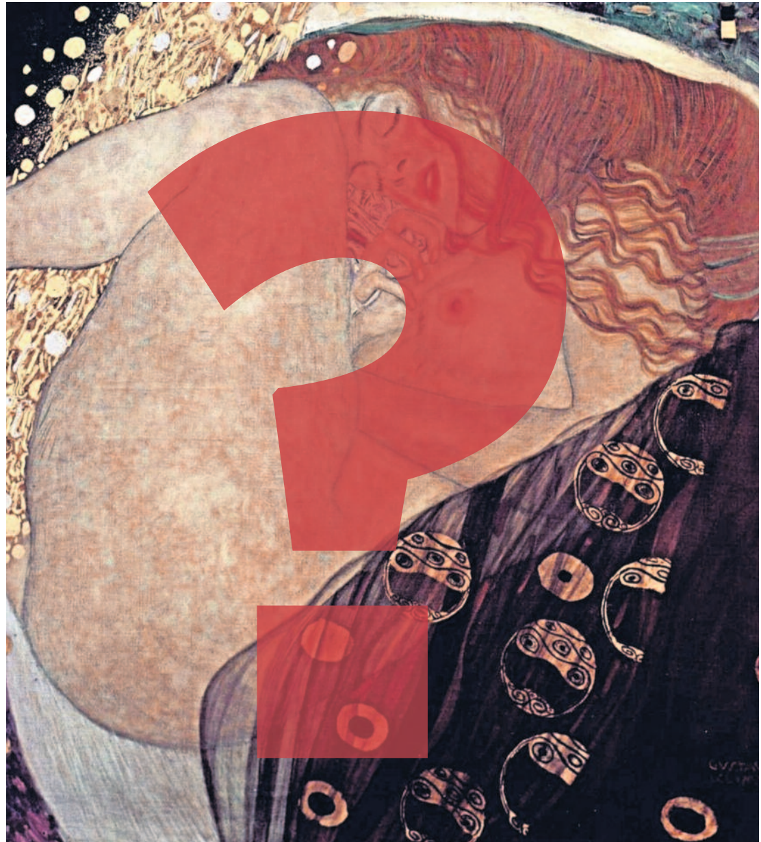
Gustav Klimt, 'Danaë', 1907