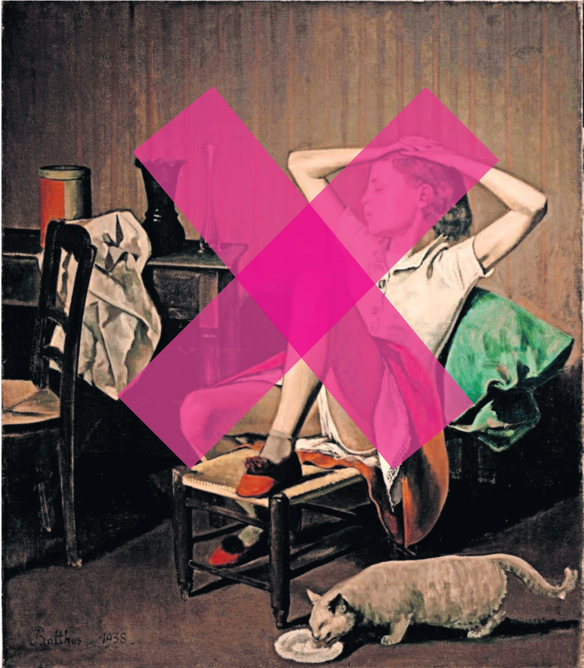
Balthus, 'Thérèse Dreaming', 1938

Dat streepje wit van haar onderbroek maakt ons tot voyeurs